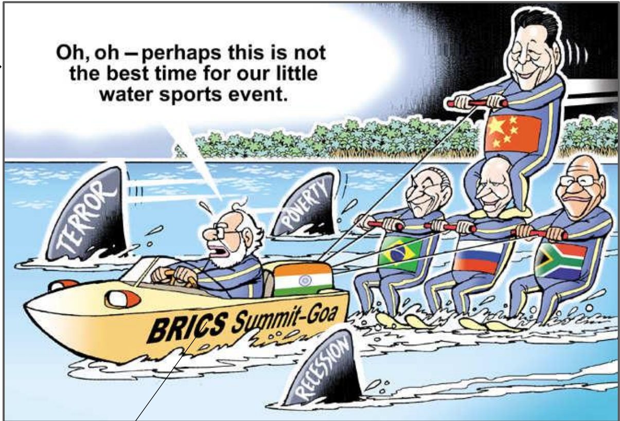
[Uit https://timesofindia.indiatimes.com/cartoons/ninans-world/brics-summit/cartoonshow/54851552.cms/ / Toegang verkry op 25 Maart 2023]

Die onderstaande spotprent is op 14 Oktober 2016 in The Times of India , 'n nuusblad wat in Delhi gesetel is, gepubliseer. Die haaivinne stel TERREUR, BERAAD, RESSESSIE en ARMOEDE voor.