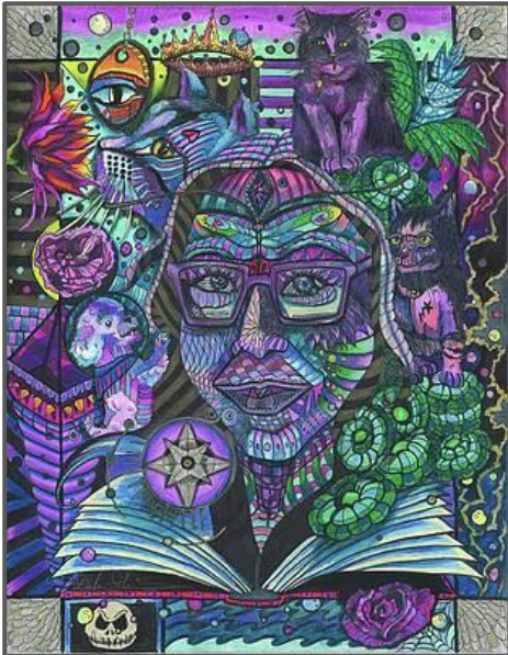
Debra Slonim, Magic Unleashed, Andrea Illuminated , olie op doek, 2021.

'n Magiese oomblik, 'n verjaarsdagviering vol betowerende pret. 'n Reënboog verskyn terwyl die jong musikant 'n klassieke deuntjie, "Happy Birthday", op sy trompet speel.