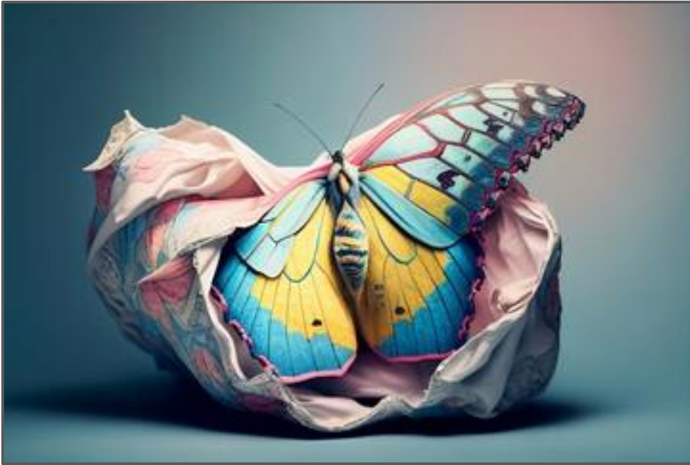
Colourful Butterfly emerging from cocoon , gegenerereer met KI deur Jonatan, datum onbekend.

Daar is vier fases in die metamorfose van skoelappers en motte: eier, larwe, papie en volwassene. Die papie hang onderstebo totdat die skoelapper in een wonderlike oomblik gereed is om as 'n volwassene uit die papie te voorskyn te kom.