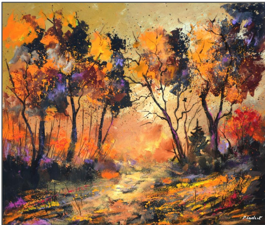
Pol Ledent, The Rich Colours of Trees in Autumn , olie op doek, 2023.