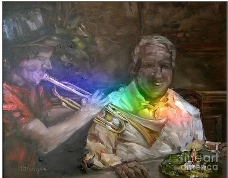
Lori Pittenger, Birthday Magic , olie op doek, 2018.

'n Magiese oomblik, 'n verjaarsdagviering vol betowerende pret. 'n Reënboog verskyn terwyl die jong musikant 'n klassieke deuntjie, "Happy Birthday", op sy trompet speel.