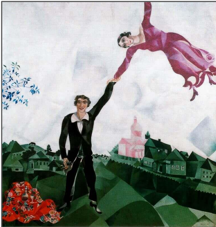
Marc Chagall: The Promenade , olie op doek, 1917.

Hierdie kunswerk van Chagall toon die uitbundige lewenslus uit, wat hand aan hand gegaan het met die nuwe fase van artistieke prestasie wat die kunstenaars bereik het. Die kunswerk toon die opwindende gevoel van vryheid en optimisme as 'n resultaat van die Oktoberrewolusie, wat plaasgevind het. Vir die Jode het die rewolusie ware bevryding beteken; uiteindelik was hulle geregtig op dieselfde volle regte as elke ander burger van die staat. Vernederings, soos wat die jong Chagall tydens sy studies in St. Petersburg beleef het, waar Jode slegs met 'n spesiale verblyfpermit toegelaat is, was nou nie meer ter sprake nie. As kunstenaar het Chagall tot die avant-garde behoort, wat alles gebaat het uit hierdie revolusionêre veranderinge.