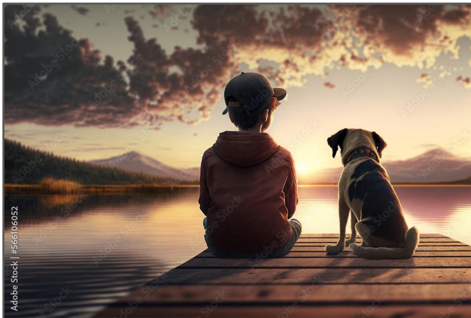
A child and dog sitting at the end of a dock watching the sunset over calm waters , wat met KI deur Roxanebaai gegenerereer is, datum onbekend.

Betowerende oomblikke in tyd, wanneer die son ondergaan. Om te kyk hoe die dag vervaag tot dit aand word, om die verandering in lig en skaduwees te sien, die weerkaatsende kleure wat die wêreld transformeer, dit is werklik betowerend.