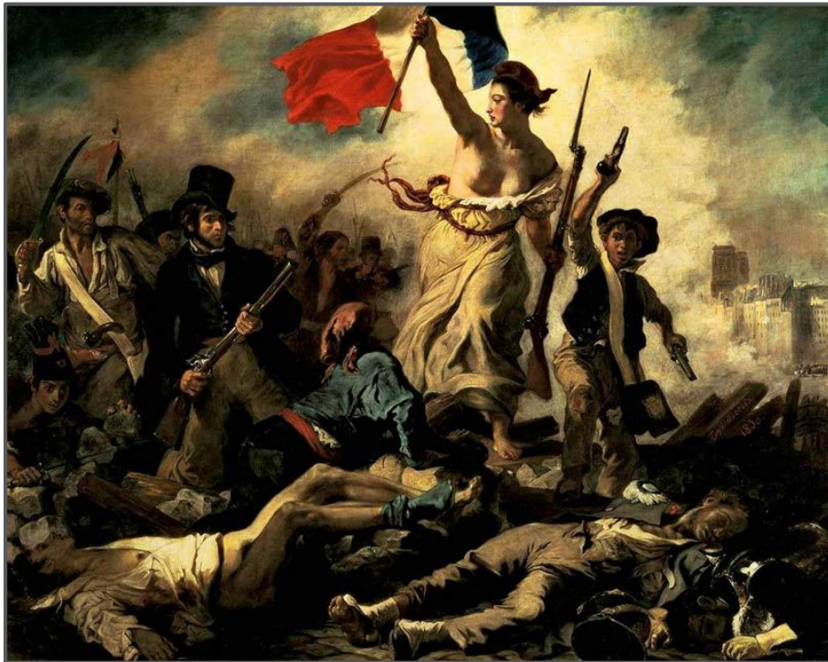
Eugène Delacroix: Liberty Leading the People , olie op doek, 1830.

Liberty Leading the People beeld 'n vrou uit wat Vryheid verpersoonlik. Sy lei 'n groep mense vorentoe bo-oor die liggame van die dooies, terwyl sy die Franse driekleurvlag omhoog hou. Die skildery vang die oomblik van 'n rewolusie vas, waar die mense die wapen teen die regering opgeneem het en geveg het vir hul vryheid.