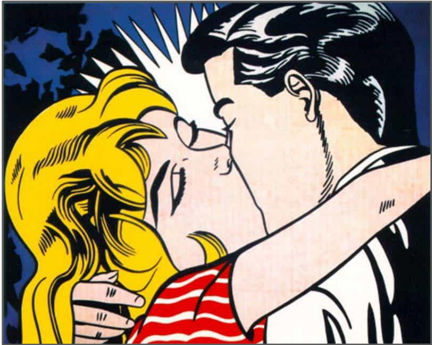
Roy Lichtenstein: Kiss II , olie op doek, 1961.

Die Amerikaanse popkunsenaar Roy Lichtenstein is bekend vir sy komiese styl van Popkuns. In hierdie kunswerk, een van verskeie beelde van omhelsende paartjies, moet ons as toeskouers besluit of die soen te wyte is aan 'n hartseer afskeid of 'n vreugdevolle ontmoeting.