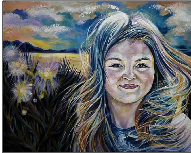
Anna Duyunova, My Summer Visitor , olie op doek, 2017.